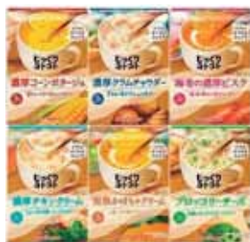
じっくりコトコスープ 12箱セット