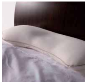
ジムナストプラス カバーセット