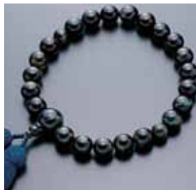
数珠 男性用 青虎目石 正絹房 桐箱入

企業誘致の推進や、ふるさと納税制度の返礼品の充実により、一般財源の確保を図りたい。